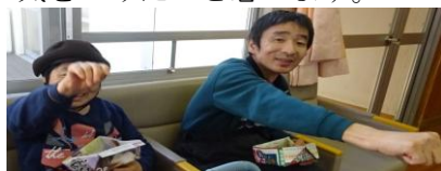
鬼に扮した職員にむけて豆まき中

節分に合わせ、豆まきをし、恵方巻きを食べました。本格的な春の到来までは、体調に充分気をつけたいと思います。